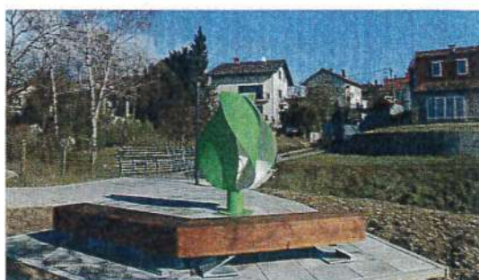
Nogostup i rasvjeta u GZ »Jalšovec«, parkiralište kod DV Radost i skulptura na stazi Sud-p. Reka