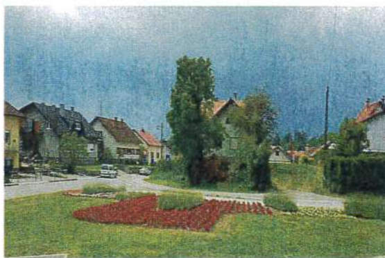
Tablica br. 14: Ciljevi upravljanja kvalitetom (zelene površine)