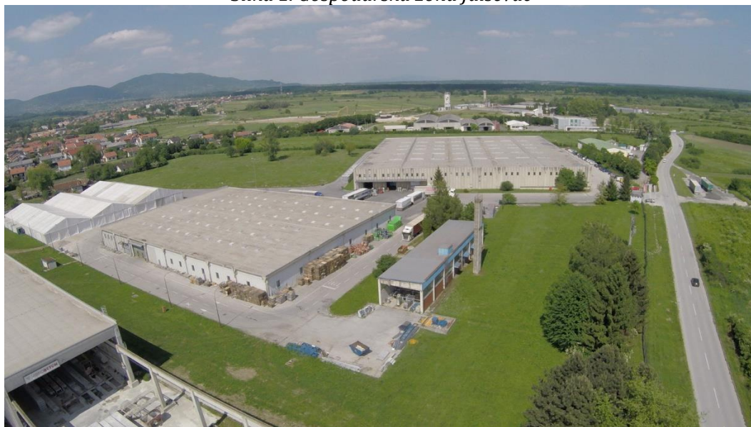
Slika 1. Gospodarska zona Jalševac

U narednim tablicama prikazana je struktura vlasništva unutar Zone i njeni raspoloživi kapaciteti.